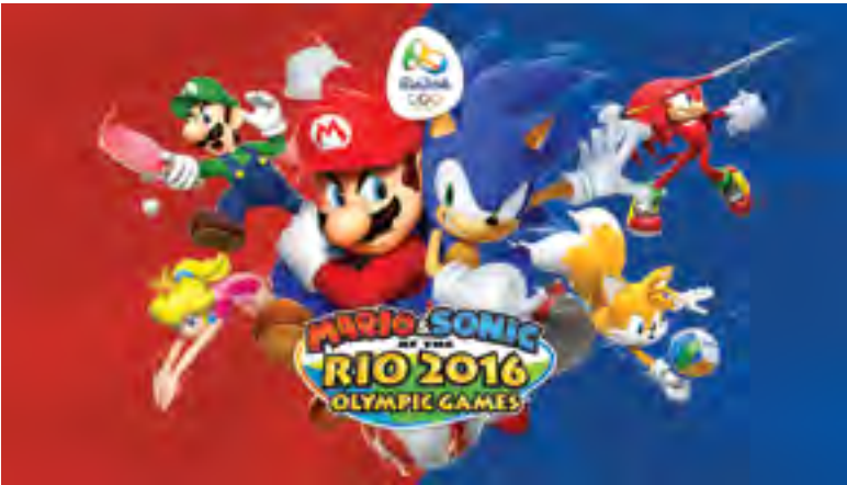
TM IOC/RIO2016/36USC220506. © 2015 IOC.

Products Interactive entertainment software (video games, mobile/tablet games, online games & arcade)